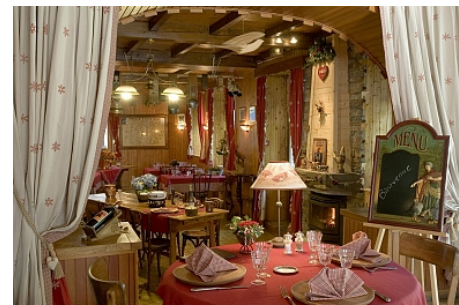
Hôtel de l'Union

https://base.apidae-tourisme.com/objet-touristique/149148/