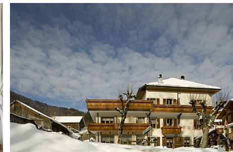
Hôtel de l'Union