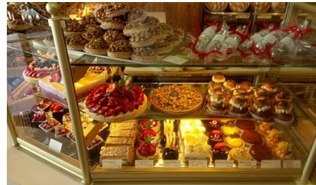
Le Fournil Lullinois