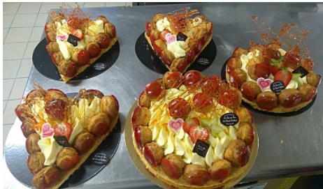
Le Fournil Lullinois

Boulangerie/Pâtisserie/Chocolaterie/Salon de Thé au coeur du village de Lullin. Découvrez les chocolats maison, de délicieuses pâtisseries et profitez-en pour boire un petit café au salon de thé.