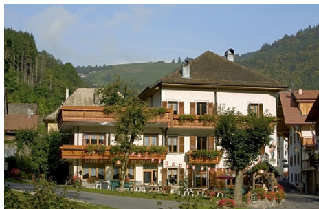
Hôtel de l'Union

Au cœur des Alpes du Léman, l'hôtel Restaurant de l'Union vous accueille depuis 1865. (adhérent à fairbooking.com) Pour vos vacances, entre amis ou en famille, laissez-vous séduire par l'hôtel, ses lacs, ses montagnes et sa cuisine authentique et savoyarde.