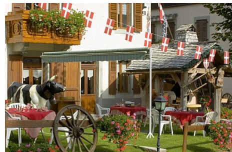
Hôtel de l'Union